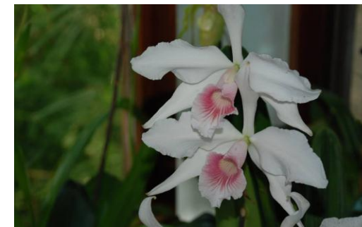
Cattleya purpurata var. carnea

Belas e misteriosas atraem todos quantos se cruzam com elas. As orquídeas encantam pela sua singularidade, forma, cor, textura e pelo seu perfume.